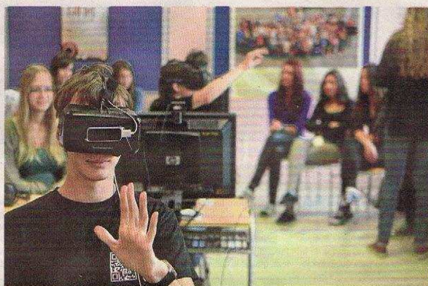
LA REALIDAD VIRTUAL ES una de las tecnologías que traerá grandes retos a nivel de contenidos para la educación.

riamos enamorar a los docentes porque estas herramientas son estudiadas y exploradas por los mismos estudiantes, y ellos quieren utilizarlas.